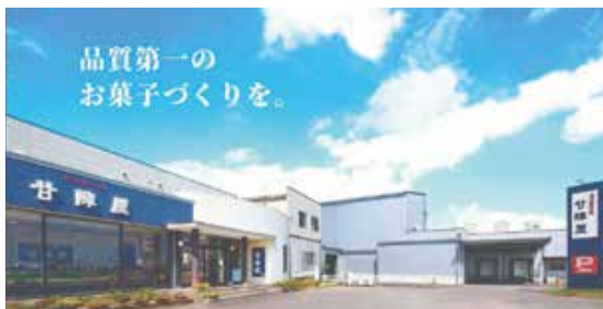
株式会社丸きんまんじゅう