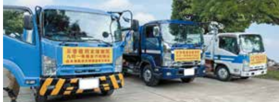
佐賀県環境整備事業協同組合