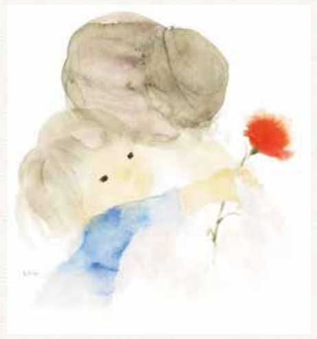
母の日 いわさきちひろ 1972(昭和47)年 ちひろ美術館蔵

【関連イベント】 イベントの詳細は佐賀県立博物館・美術館ホームページでご確認ください。