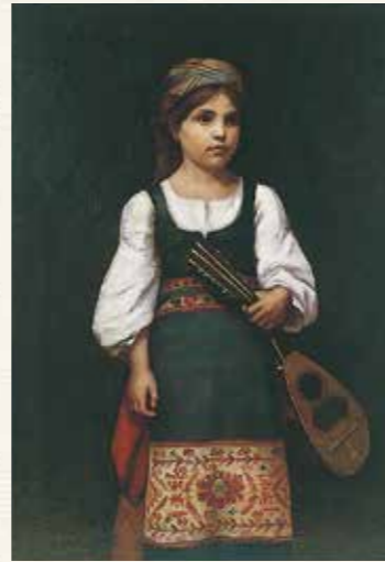
マンドリンを持つ少女 百武兼行 1879(明治12)年 公益財団法人鍋島報効会蔵 佐賀県重要文化財