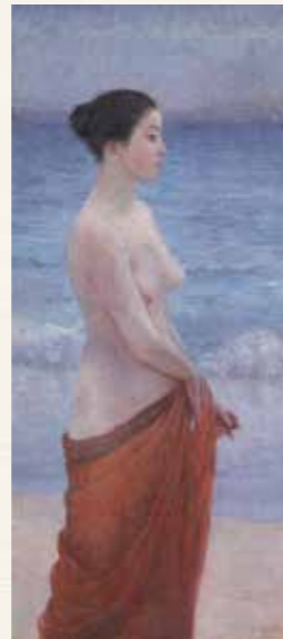
海辺裸婦 岡田三郎助 1914(大正3)年 親和アートギャラリー蔵