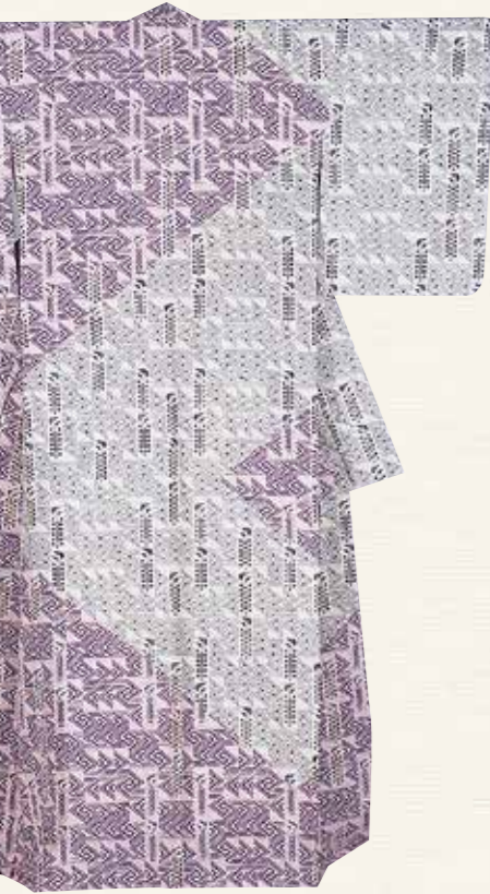
木版摺更紗着物惣果文 鈴木滋人 1999(平成11)年 佐賀県立美術館蔵