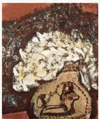
花(ヴェロンにて) 三岸節子 1988(昭和63)年 一宮市三岸節子記念美術館蔵 ©MIGISHI