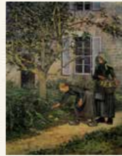
林檎拾い 久米桂一郎 1891(明治24)年 久米美術館蔵