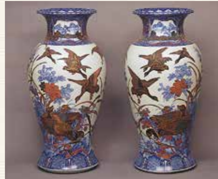
染付蒔絵芙蓉雁文大花瓶 1875~1879(明治8~12)年頃 有田ポーセリンパーク蔵

幕末・明治維新时期から現代まで、佐賀ゆかりの名品を「美」と「技」という2つのテーマで紹介。「美」をテーマにした展示では、明治以来150年にわたって美を表現し、活躍してきた芸術家たちの代表作を展示します。また「技」をテーマにした展示では、幕末期から明治期にかけて国内外で開催された各種博覧会への出品作から現代の名品までを展示。佐賀のものづくりの底力・奥深さにふれてください。