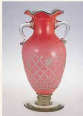
紅被せガラス花垣文耳付花瓶 精練合資会社・青木熊吉 1910(明治43)年頃