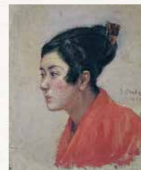
若き日の三岸節子像 岡田三郎助 1923(大正12)年