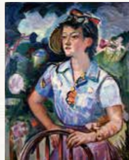
朝 有馬三斗枝 1957(昭和32)年 佐賀県立美術館蔵