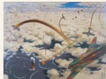
ニューギニア沖東方敵機動部隊強襲 御厨純一 1942(昭和17)年 東京国立近代美術館(無期限貸与作品)