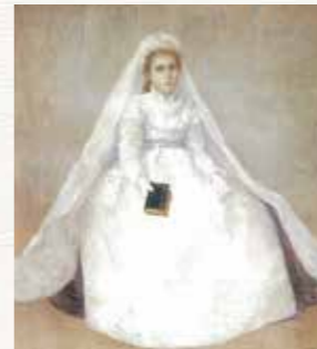
白衣の少女 岡田三郎助 1901(明治34)年