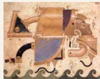
Amosu Norle 野村昭嘉 1990(平成2)年 佐賀県立美術館蔵