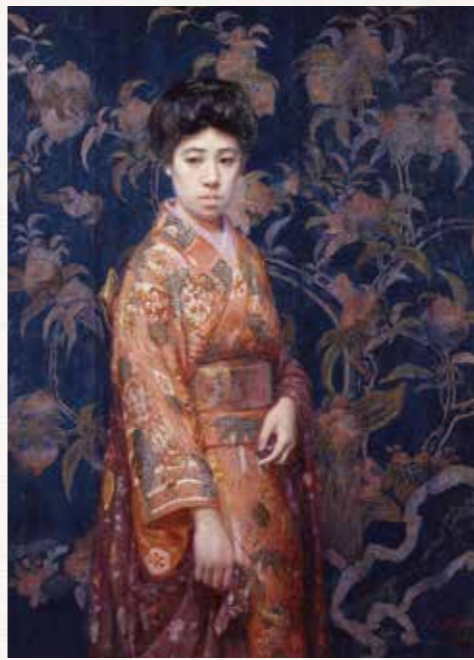
支那絹の前 岡田三郎助 1920(大正9)年 高島屋史料館蔵