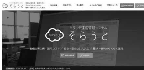
安価な導入費・運用コスト