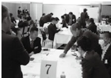
▲ 事業計画について、話し合う様子