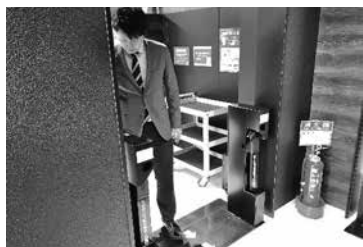
▲自動ゲートを通る様子