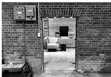
↑会場内のインスタ映えスポット