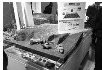
▲事業展示ルームにて