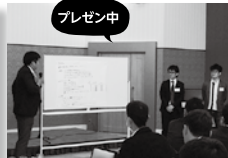
▲ 考えた事業計画について発表する様子