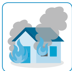
建物が燃えてしまった

火災共済では、火事で家が燃えてしまったときの補償はもちろん、台風で屋根が飛ばされてしまった場合などの“風災”による損害や、洪水で床上浸水した場合などの“水害”などの自然災害による損害や、窓を割られて空き巣に入られたときの“盗難”などの日常生活における事故も補償します。