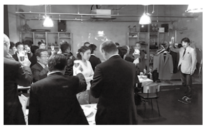
懇親会は、洲上直前会長による乾杯でスタート!!