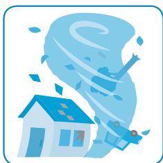
台風で屋根が飛んだ