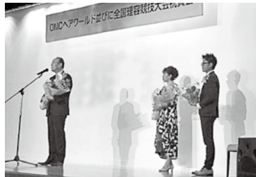
↑受賞者御礼挨拶の様子