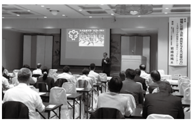
講演では、魂を揺すぶられ、鳥肌が立つ参加者が続出しました!!