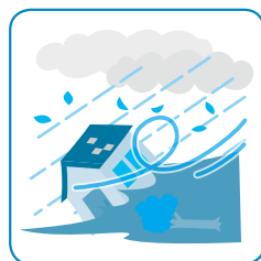
豪雨による土砂崩れで家が全壊した