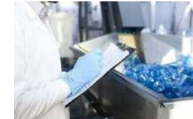
規制対応のためのコンサルや認証取得