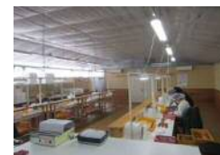
パッキング設備の導入