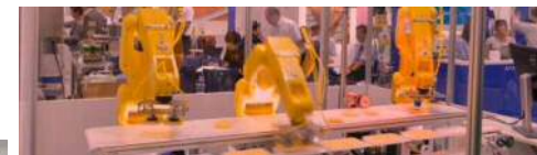
新たな製造ライン