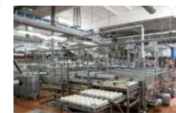
多言語ラベル機の導入